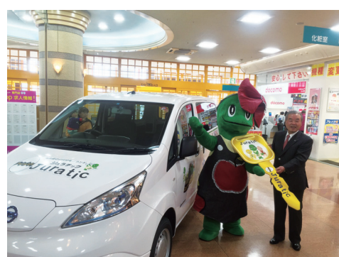
福井日産さんから電気で走るジュラチックカーが進呈されたじゅら!

ラプリーパートナー Lpa Lovely partner 〒910-0836 福井県福井市大和田2丁目121番地 TEL:0776-57-2525 営業時間 AM10:00~PM8:00