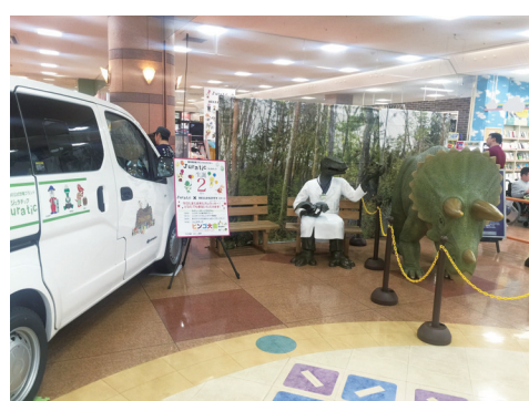
恐竜博士たちも恐竜博物館から応援に来てくれたじゅら。