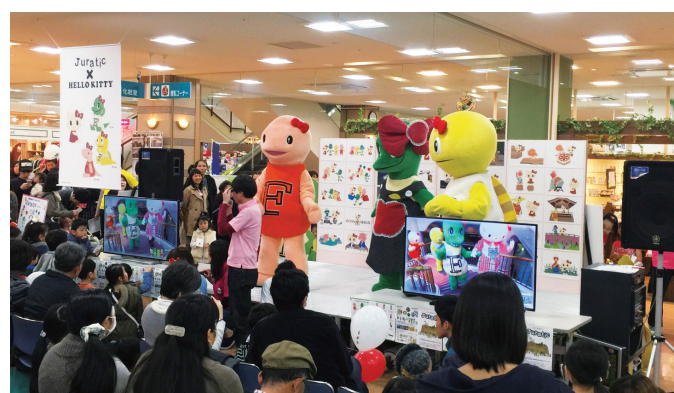
ハローキティとのコラボ映像の紹介などイベント盛りだくさん! いつも応援してくれているお友だちがいっぱい集まってくれたじゅら!

めにもすっかりしたものをつくりたいと思いました。 一年間の試行錯誤を経てやっとこのラプトくんバリケードが完成したときは本当にうれしかったです!... 野尻 今回のバリケードの開発を通じてよかったことはありますか? 吉田 ご好評をいただいています。ラプトくんを通して私たちの会社にもっと親近感をもってもらえたなら嬉しいです。 また僕自身ものづくりに携わるこの仕事が好きですが、バリケードを見た子どもや学生さんにもものづくりに関わる仕事に興味を持っていただけたらいいですね。 ラプトくんを通して私たちの会社にもっと親近感をもってもらえたなら嬉しいです。 また僕自身ものづくりに携わるこの仕事が好きですが、バリケードを見た子どもや学生さんにもものづくりに関わる仕事に興味を持っていただけたらいいですね。