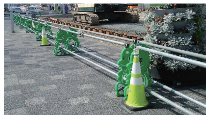
ラプトのバリケードで工事現場の安全を守るじゅら! 福井県内のあちこちのいるじゅらよ~♪

めにもすっかりしたものをつくりたいと思いました。 一年間の試行錯誤を経てやっとこのラプトくんバリケードが完成したときは本当にうれしかったです!... 野尻 今回のバリケードの開発を通じてよかったことはありますか? 吉田 ご好評をいただいています。ラプトくんを通して私たちの会社にもっと親近感をもってもらえたなら嬉しいです。 また僕自身ものづくりに携わるこの仕事が好きですが、バリケードを見た子どもや学生さんにもものづくりに関わる仕事に興味を持っていただけたらいいですね。 ラプトくんを通して私たちの会社にもっと親近感をもってもらえたなら嬉しいです。 また僕自身ものづくりに携わるこの仕事が好きですが、バリケードを見た子どもや学生さんにもものづくりに関わる仕事に興味を持っていただけたらいいですね。